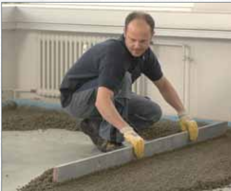
Uitstrooken van de lichtgewicht uitvlakmortel UZIN SC 914 Turbo (UZIN NC 194 Turbo).