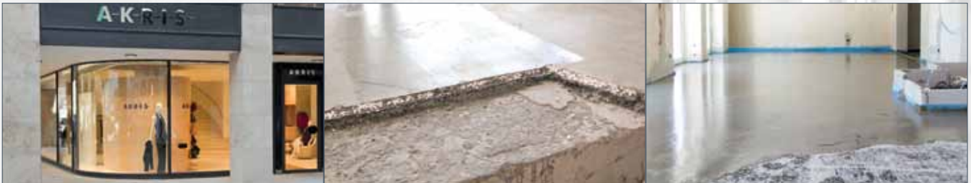
Modehuis Akris in München