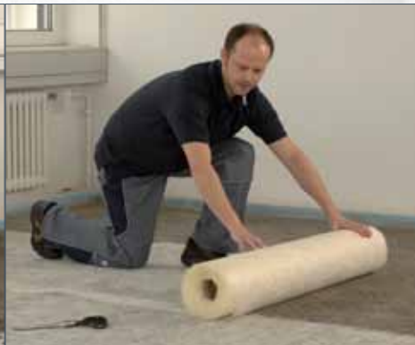
Plaatsen van het renovatievlies UZIN RR 201.