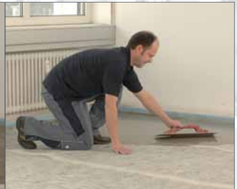
Uitstrooken van de vloermortel UZIN NC 195.

De unieke combinatie van de verschillende componenten van het Turbolight®-Systeem, dat bestaat uit UZIN SC 914 Turbo (UZIN NC 194 Turbo), UZIN RR 201 renovatievlies en UZIN NC 195 vloermortel, maakt het mogelijk om snel en flexibel hoogteverschillen uit te vlakken met een minimaal oppervlaktegewicht. Het gepatenteerde systeem is eenvoudig te verwerken, vervormt niet en is spanningsarm. Daarnaast heeft het een lage dichtheid en een hoge warmte-isolatie waarde. Het systeem is met de gebruikelijke verwerkingstechnieken aan te brengen en heeft een versnelde uitharding en droging. Dit maakt het Turbolight®-Systeem tot een ideale probleemoplosser bij strakke deadlines. Het systeem zorgt voor een opmerkelijke reductie van geluid (10dB). Belangrijk bij de renovatie van oude gebouwen! Daarnaast is het systeem watervast, dus ook onbeperkt toe te passen in vochtige ruimtes. Op het uitgeharde systeem kunnen elastische vloerbedekkingen, tapijt, parket, tegels en natuursteen op de gebruikelijke wijze worden geïnstalleerd.